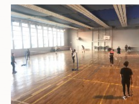
Le badminton en option EPS

En classe de première et de terminale, vous vivrez de manière approfondie le badminton et la course à pied.