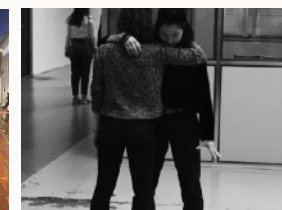
Les duos en Art/danse