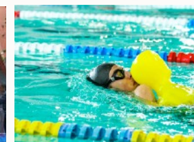
L'activité sauvetage sportif