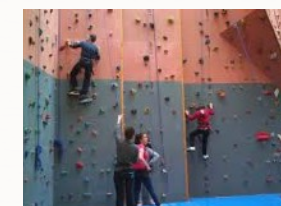
L'activité escalade en voie

Les activités d'escalade, natation, tennis de table, handball, équitation, sauvetage sportif, cirque, ultimate, pentabond et de course vous seront proposées en plus de cours théoriques (1h par semaine) où vous approfondirez les principes de l'activité physique.