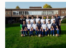
Le foot féminin sur terrain à 11 et en futsal.

Suite à des sélections sportives et scolaires, vous pouvez intégrer une des trois sections (football féminin, art danse ou cyclisme) ayant pour objectif de vous préparer aux diverses compétitions dans l'année.