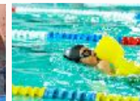
L'activité escalade en voie L'activité sauvetage sportif