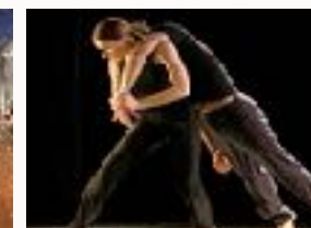
Le badminton en option EPS Les duos en Art/danse